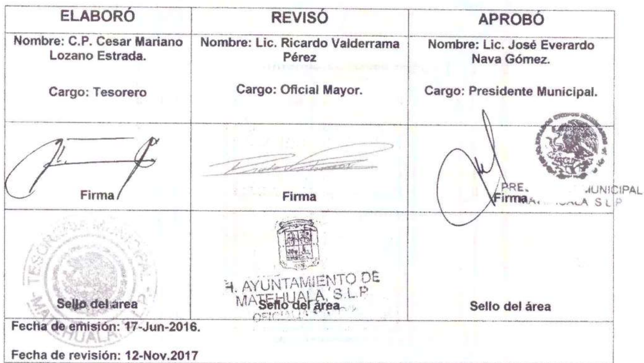
Tabla 6: Elaboración, revisión y aprobación del Manual Interno de la Tesorería Municipal, Administración, 2015-2018.

Y las que indiquen el marco legal aplicable o las que le indique el ayuntamiento, el Presidente Municipal y su jefe inmediato superior.