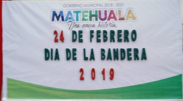
ACTO CIVICO Y DESFILE CONMEMORATIVO AL "DIA DE LA BANDERA"