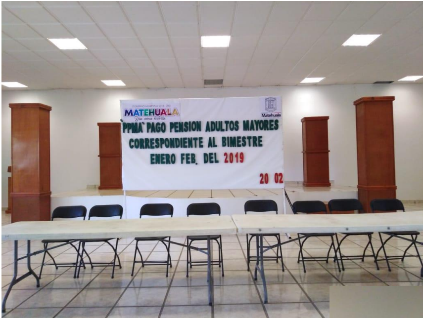
PAGO PENSION ADULTOS MAYORES BIMESTRE ENE-FEB (FOM. AGROPECUARIO)