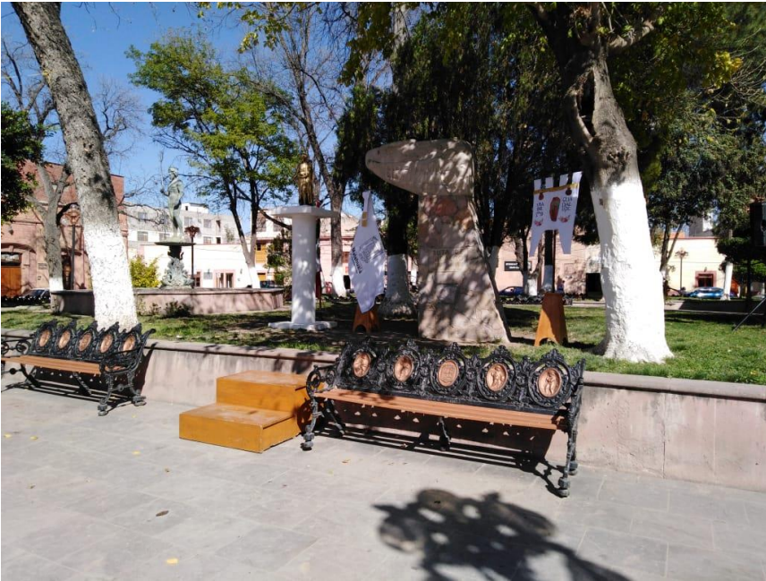
CABALGATA DE LA INSURGENCIA