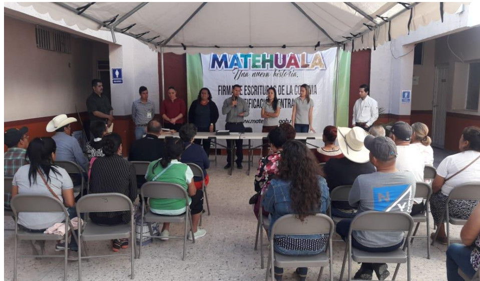
FIRMA DE ESCRITURAS DE LA COLONIA LOTIFICACION CENTRAL (OBRAS PUBLICAS)