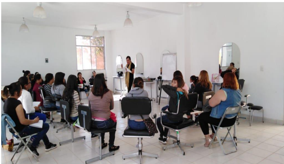
ARRANQUE DEL 1ER. CURSO DE BELLEZA (DIF)