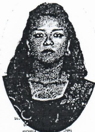
ESCUELA NORMAL DE ESPECIALIZACION SALTILLO, COAHUILA