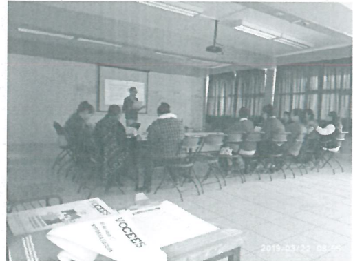
Ilustración 2 Exposición CEEPAC