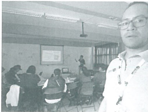
Ilustración 3 Descripción de las etapas del Parlamento Infantil 2019