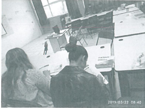
Ilustración 1 Registro de asistentes.