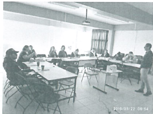
Ilustración 4 Resolución de dudas y comentarios