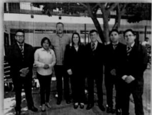
Alumnos y Asesores Integrantes del Proyecto Dispositivo Despierta y Vive en Expociencias Estatal