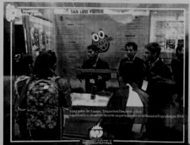
Alumnos y Asesores Integrantes del Proyecto Dispositivo Despierta y Vive en Expociencias Nacional