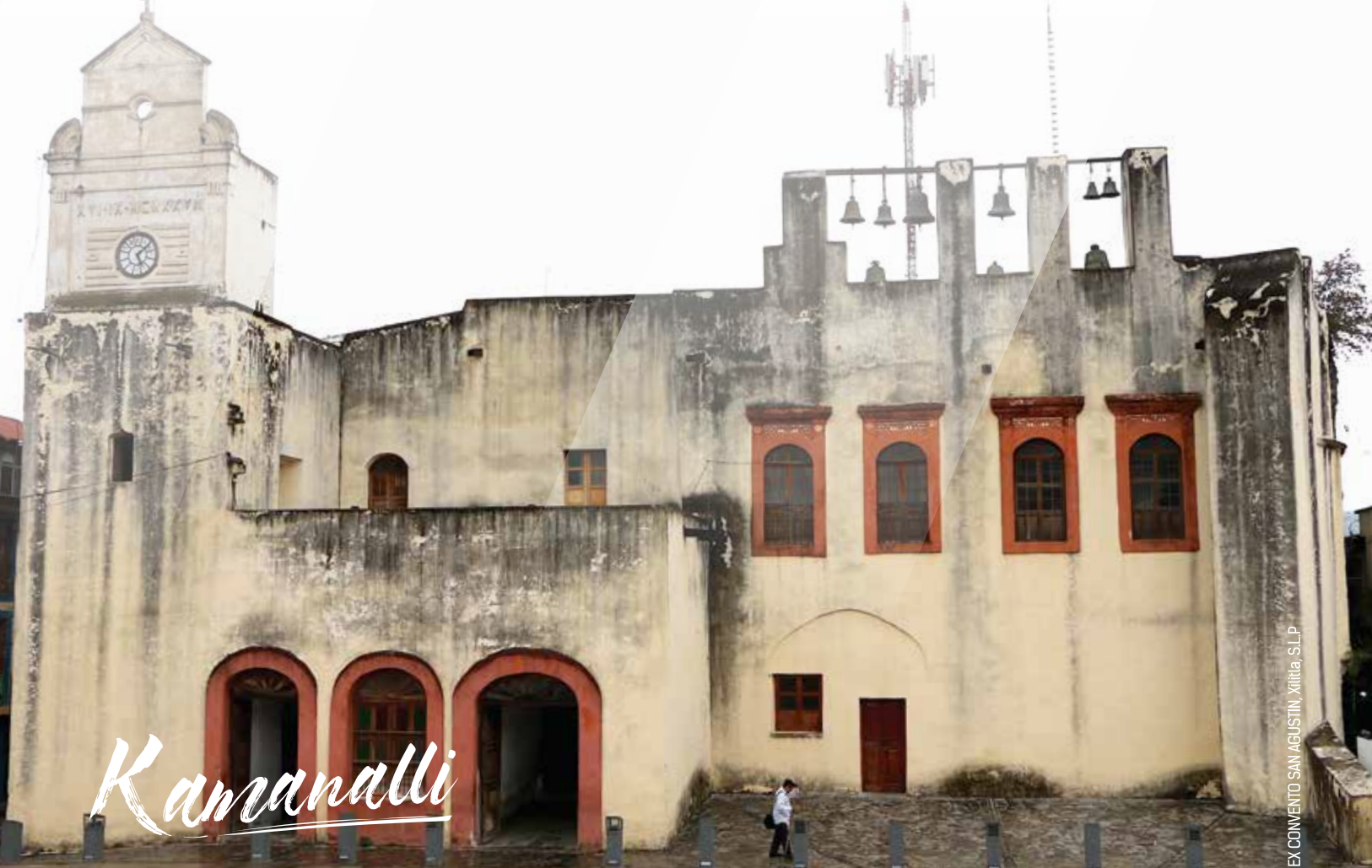
EX-CONVENTO SAN AGUSTÍN, XILITLA, S.L.P.