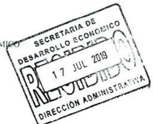
GUSTAVO PUENTE OROZCO SECRETARIO DE DESARROLLO ECONÓMICO