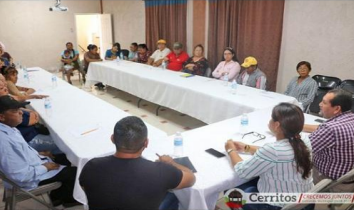
INFORMAN SOBRE CLÍNICA DE HEMODIÁLISIS EN CERRITOS