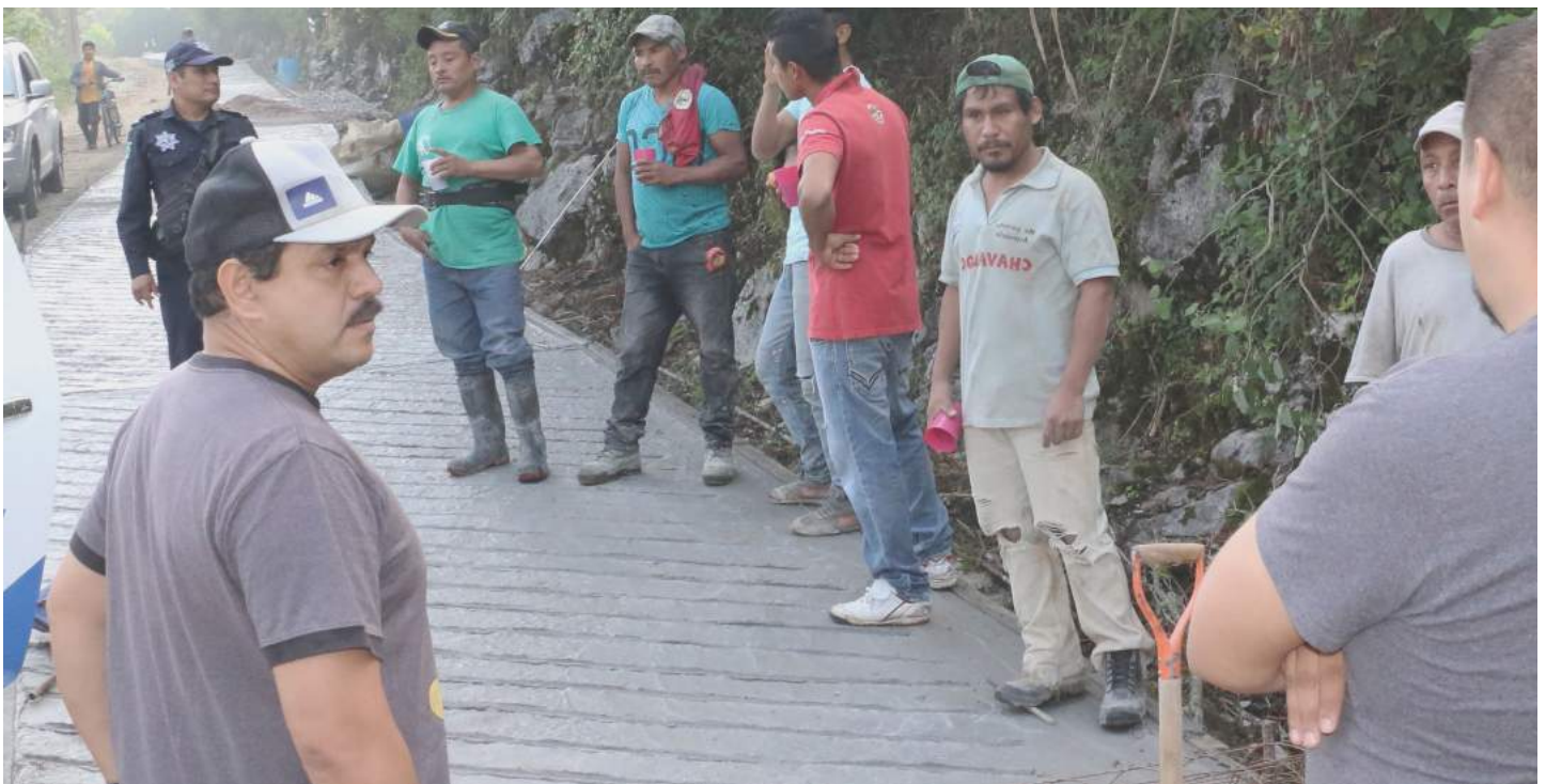
Gira de trabajo por la zona alta de Xilitla (supervisión de rampas de la comunidad de Miramar a la Trinidad)