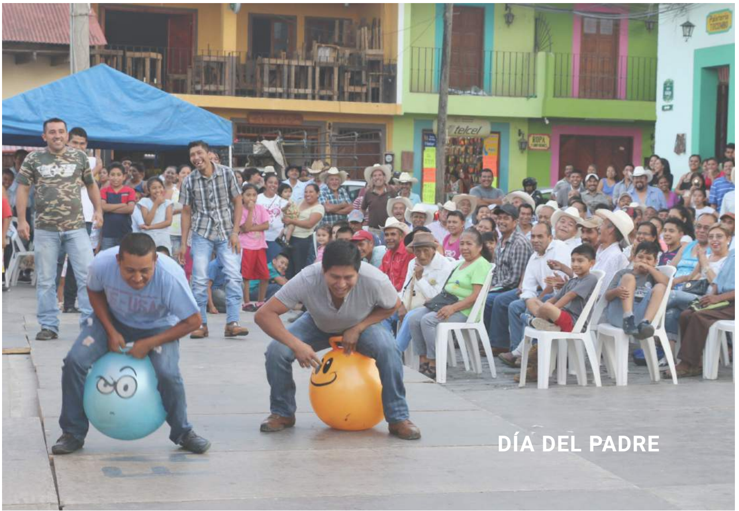
DÍA DEL PADRE