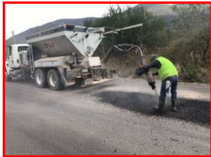
(Trabajos de bacheo carretera tramo Pinihuan-Lagunillas)