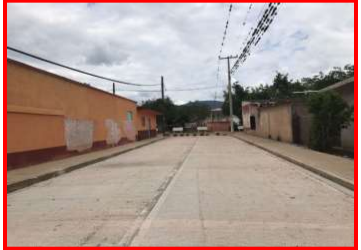
CALLE HIDALGO SAN RAFAEL, LAGUNILLAS, S.L.P.