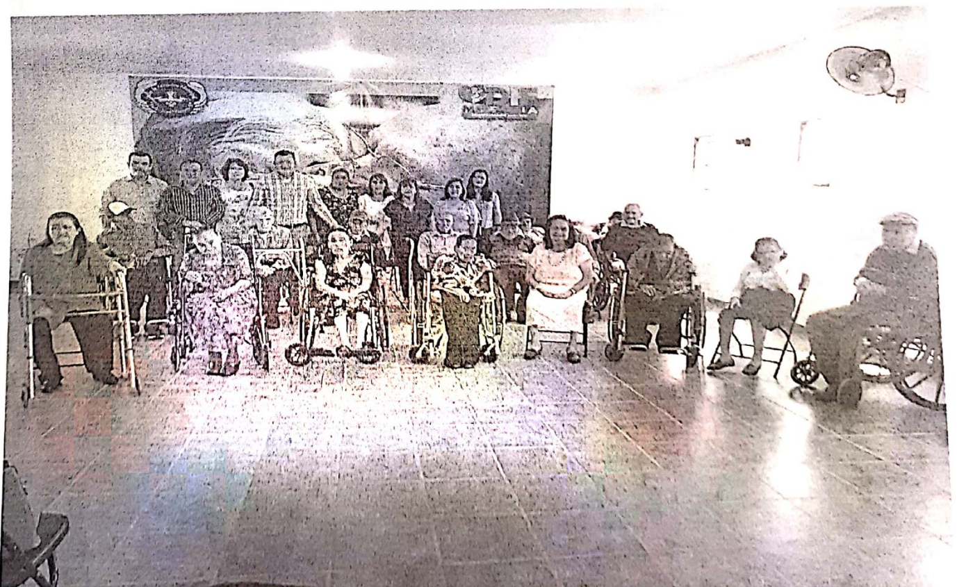
Visita del cuerpo de regidores