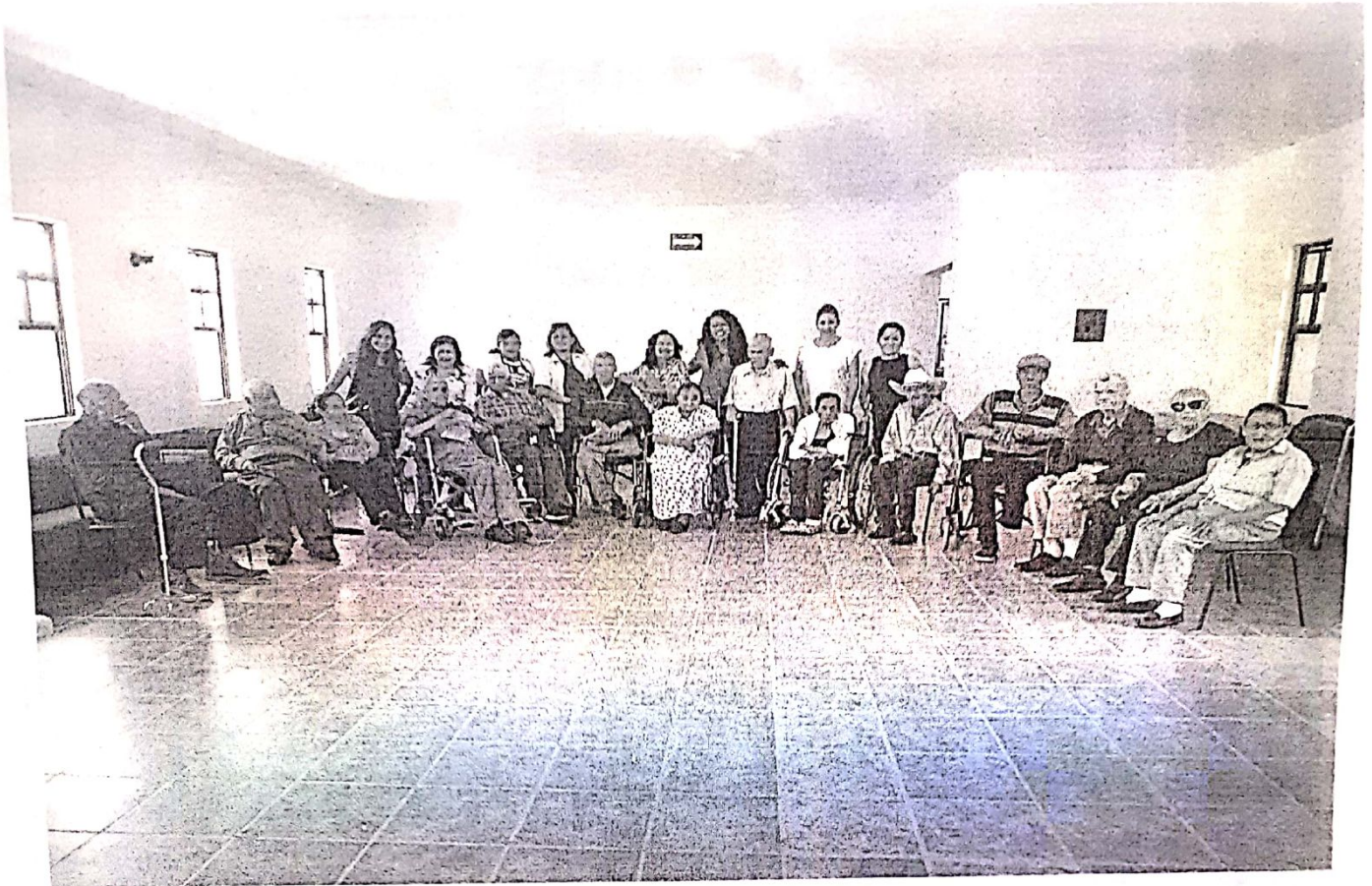
Estilitas y podologas en el día de la belleza