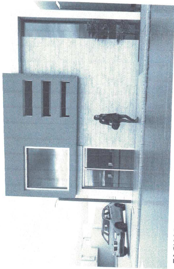
FACHADA CALLE HIDALGO