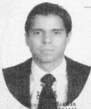
UNIVERSIDAD MARISTA Rector Clave Institucional: 24MSU0009M