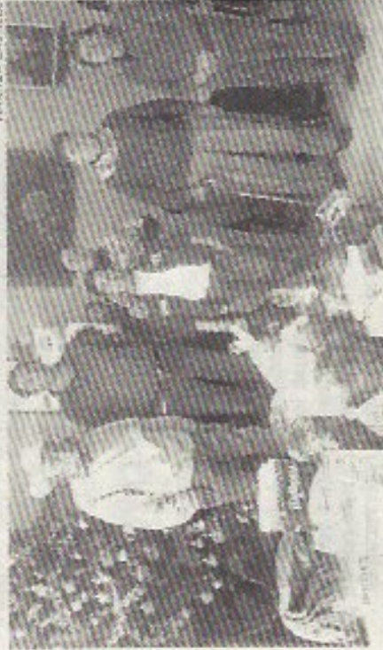
VOLUNTARIADO Y ASOCIACIONES apoyan a los adultos mayores que acuden a la casa de descanso.