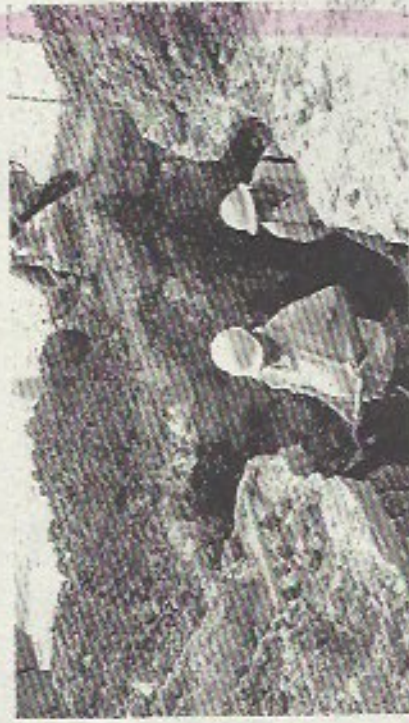
POR FUGA en calle Morelos el Organismo de Agua suspendió por unas horas el servicio del vital líquido.

Es por eso emiten recomendaciones de que usen responsablemente el internet y redes sociales, en caso de niños y jóvenes sean supervisados por un adulto.