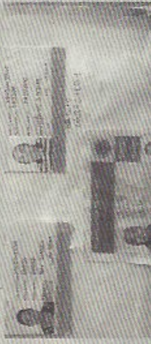
CUALQUIER tipo de tarjetas del INAPAM deben recibirlas en dependencias donde ofrecen descuentos.