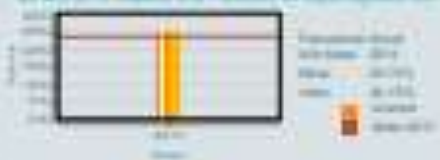
Indicador de cobertura de subsidios otorgados por los subsidios de acceso al financiamiento habitacional a nivel FN 2017, respecto a la Población de bajos ingresos con...