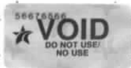
PLATE STICKER / CALCOMANIA DE PLACA

Peel sticker from any corner. Despegue la calcomanía de cualquier esquina.