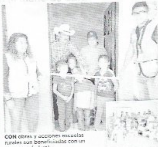
CON obras y acciones escuelas rurales son beneficiadas con un programa federal.

Tudo esto para que los niños y las niñas puedan tener una escuela de calidad donde puedan llevar acabo su aprendizaje