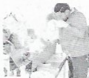
PARA APOYAR en programas de salud, en el DIF necesitan de un veterinario y un médico general.

En el caso del médico general de apoyar en las campañas de salud que efectúan en comunidades.