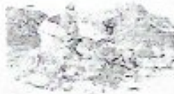
CADA VEZ son más los usuarios a los que da el servicio OOSAPA.

Cervantes González, dijo, están pendientes de que el servicio a los usuarios sea el óptimo, por ello cada día supervisan el área de pozos y atienden los reportes de ciudadanos, todo con el fin de ofrecer la mejor atención a la ciudadanía.