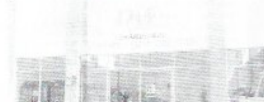
TANTO EL DIF como en el ayuntamiento permanecen cerrados los edificios.

En lo que respecta a las oficinas del Ayuntamiento trabajan a puerta cerrada, hay personal en todos los departamentos y dan entrada a las personas que requieran realizar trámites urgentes, con las medidas pertinentes, esto con el fin de cuidar la salud e integridad de todos los usuarios que acuden, así como a las personas que brindan la atención.