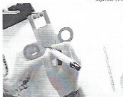
DIVERSIDAD de talleres ofrece el ICAT a la población.