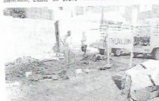
PERSONAL DE OOSAPA pendiente en la rehabilitación de la red de drenaje y agua.

Ante algunas dependencias como la Comisión Nacional del Agua gestionan apoyos, y conseguir esas obras de reposición de las redes.