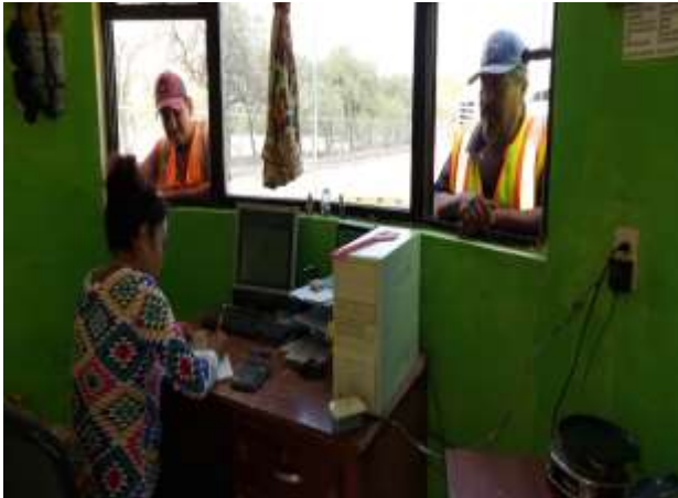
ACTIVIDADES DE PESAJE VEHICULOS)