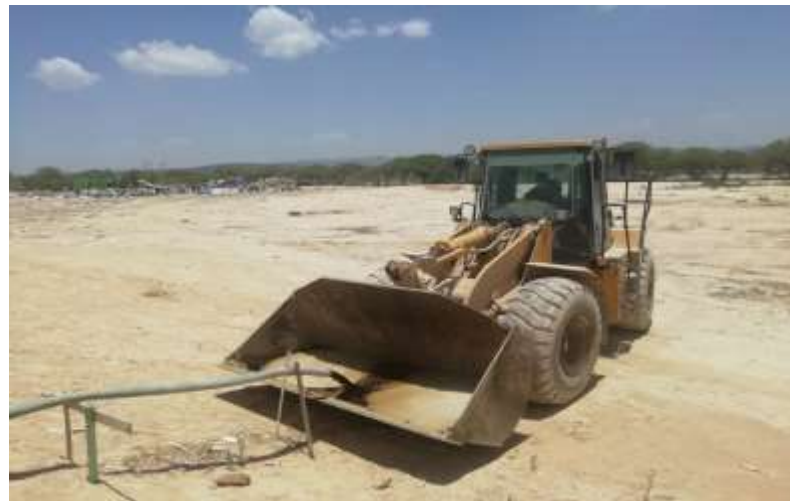
EXTRACCION DE LIQUIDOS LIXIVIADOS