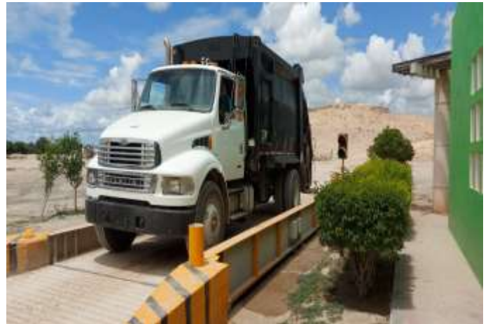
(BASCULA PESAJE DE

SE REALIZA EL PESAJE EN LA BÁSCULA A TODOS LOS VEHICULOS QUE INGRESAN A DEPOSITAR LOS RESIDUOS SOLIDOS EN EL RELLENO SANITARIO (PESAJE ENTRADA Y SALIDA DEL VEHICULO PARA REGISTRAR EL PESO NETO DE RESIDUOS SOLIDOS QUE INGRESAN AL RELLENO SANITARIO).