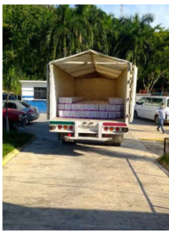
Recepción y entrega de la leche de la modalidad asistencia alimentaria en los primeros 1000 días de vida