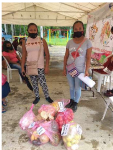
Entrega de fruta a las 23 localidades Con Desayunos Escolares Calientes.