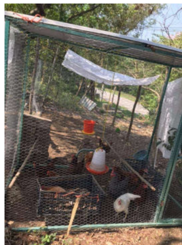
Supervisión de Granjas Avícolas