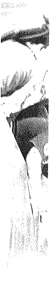
DIVERSAS INSTANCIAS participan en el censo para detectar violencia en niños.