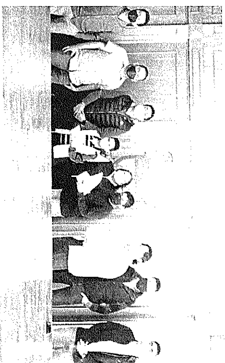
PREMIOS Y RECONOCIMIENTO dieron a los ganadores del concurso de fotografía.

del ejido de los Llanitos, tarde, informó.