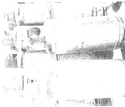
PARA EVITAR riesgos por fuga de gas, grupos de auxilio recomiendan a familias revisar los tanques.

Mencionó la vida útil es de 10 años cuando mucho, pero si están expuesto al sol y el agua hay deterioro sobre todo en la base al carcomerse o "picarse", es donde originalmente están las fugas de gas, invitó a la población a que cambie el tanque antes de que les ocurra una contingencia.