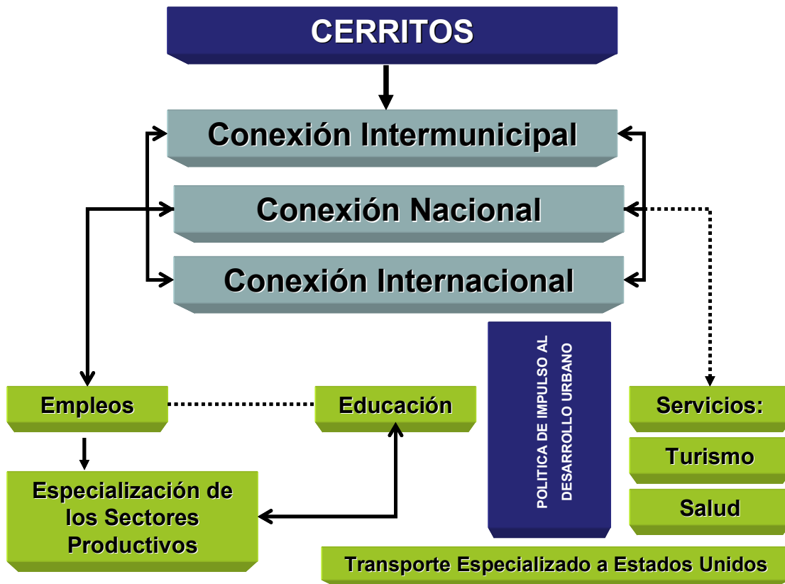
Diagrama de Relación Funcional y Económica (Cerritos)

La integración vial de sus comunidades sigue siendo prioridad para Cerritos, así como la dotación de servicios en la cabecera municipal de manera que consolide el papel de Cerritos como Centro Urbano de Industria, Comercio y Servicios Intermunicipal.