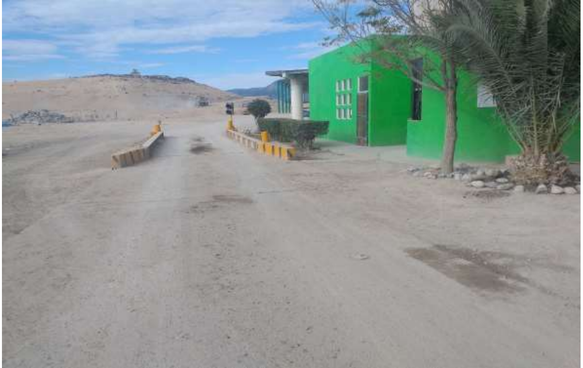
ENTRADA AL RELLENO SANITARIO