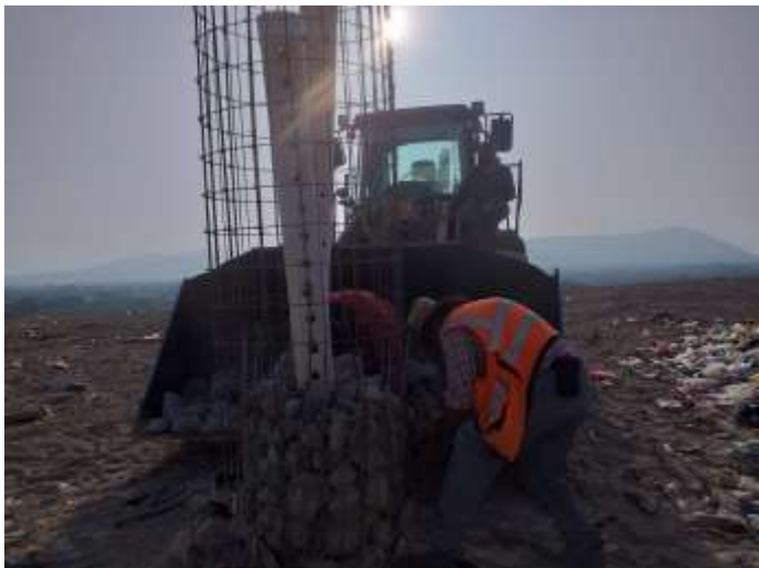
✓ AMPLIACIÓN DE RESPIRADEROS CONDICIONES ACTUALES RELLENO SANITARIO