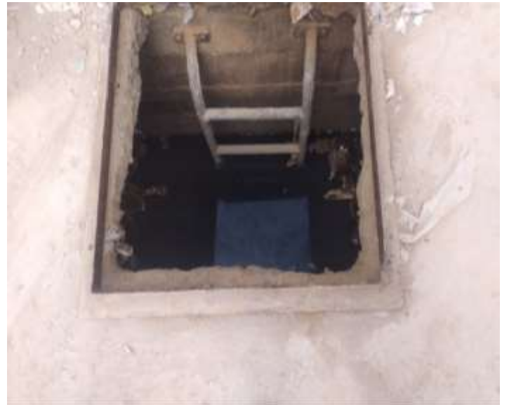
PILA DE LIQUIDOS LIXIVIADOS