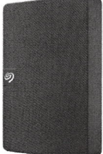
Disco duro externo seagate 5tb $3400