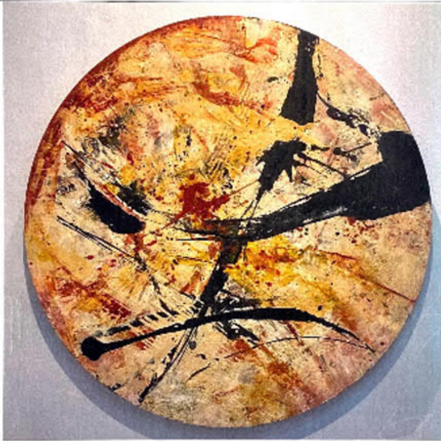
Guadalupe Lópezwogñis Enlace 2020 Técnica mixta Diámetro 122 cm.

Handwritten signature in blue ink, likely reading 'Guadalupe Lópezwogñis'.