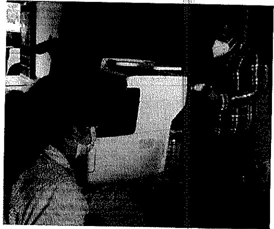
Registro para asamblea en Salinas, 14/07/2022.