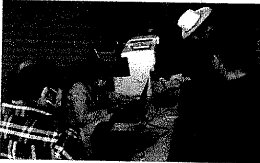
Registro para asamblea en Ahualulco, 14/07/2022.