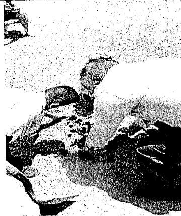
Fig. 3. Intercambio de experiencias entre directivos de Escuelas de Educación Básica y las Autoridades Educativas.