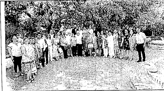
Fig. 5. Personal directivo y de supervisión, así como Autoridades Educativas participantes en la Gira de Trabajo.