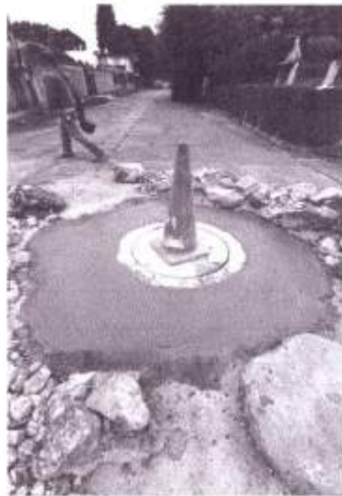
Reporte fotográfico de las acciones realizadas en redes de drenaje