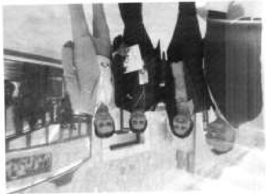
SEGUNDA SESIÓN ORDINARIA 2023 DEL COLEGIO DE DIRECTORES GENERALES DE LOS IEEA Y UNIDADES DE OPERACIÓN DEL INEA, EL 06 DE OCTUBRE EN EL ESTADO DE DURANGO, DGO.