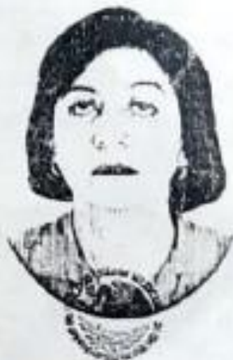
SISTEMA EDUCATIVO NACIONAL SAN LUIS POTOSÍ

el Título de Licenciada en Educación Media en el Área de Matemáticas en virtud de que cumplió en la Escuela Normal de Estudios Superiores del Magisterio Potosino