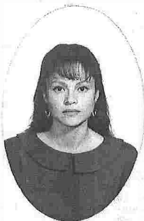
DIRECCIÓN DE CONTROL ESCOLAR