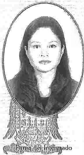
Firma del Interesado