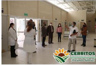
(Clínica de hemodálisis será una realidad)

Cumpliendo con los compromisos de campaña, nuestro Gobernador Electro empezará a traer el cambio a nuestro municipio otorgando lamparas LED, se comenzaran los trabajos en la cabecera y en las zonas mas oscuras, para posteriormente iluminar todo nuestro municipio, de esta manera de pretende la baja en los actos delictivos y ayudar al centro de monitoreo a brindar una respuesta rapida y clara de los sucesos que pasan dentro de nuestra localidad, de esta manera seguimos "Haciendo Historia".