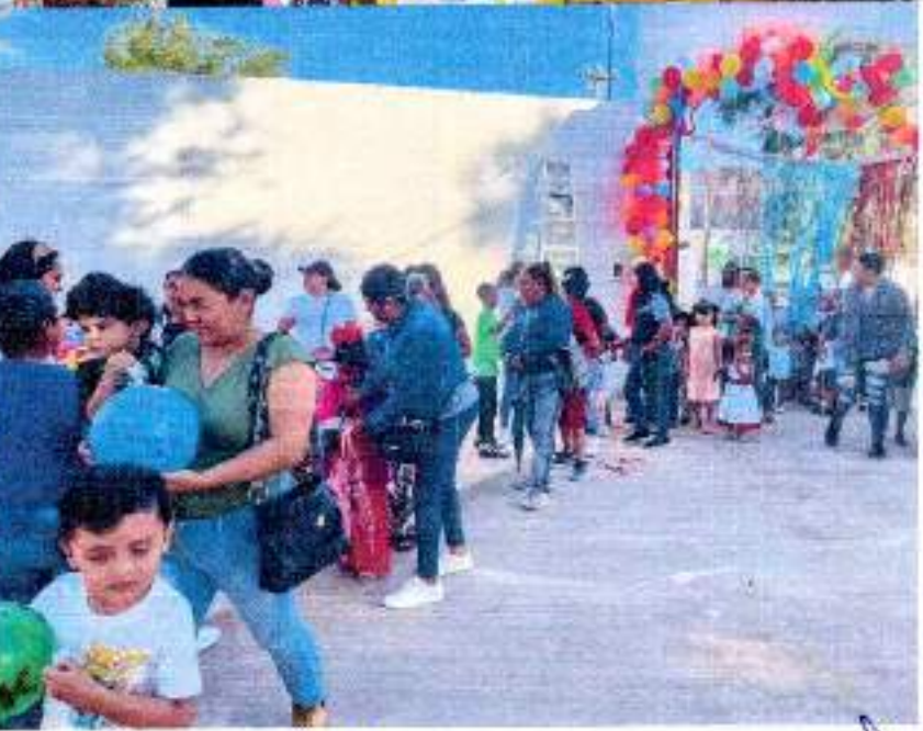
ALHA DELA AGUSLAR M o Pinam Manisa Magaña Mte.