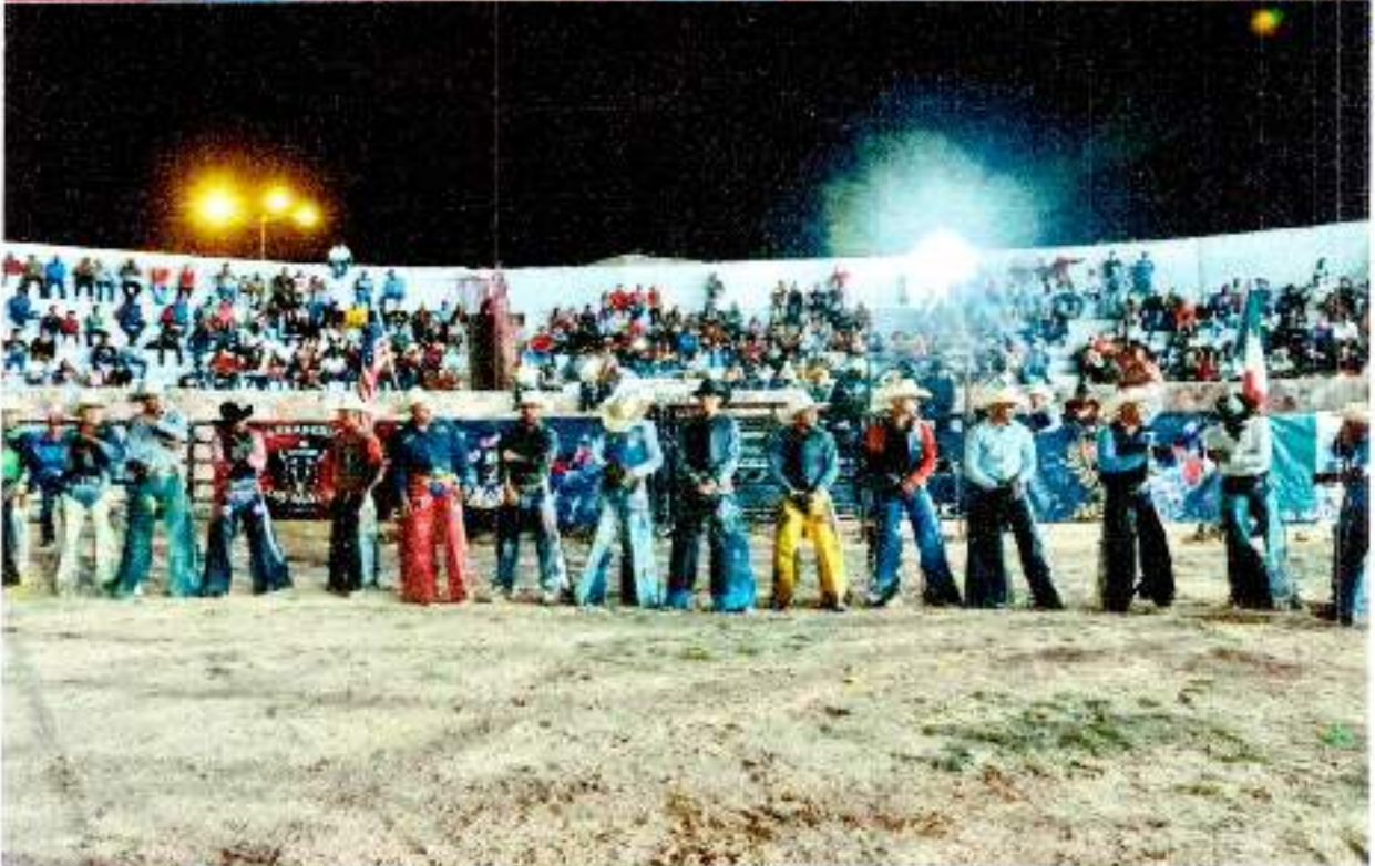
EVENTO: DIA DEL PADRE