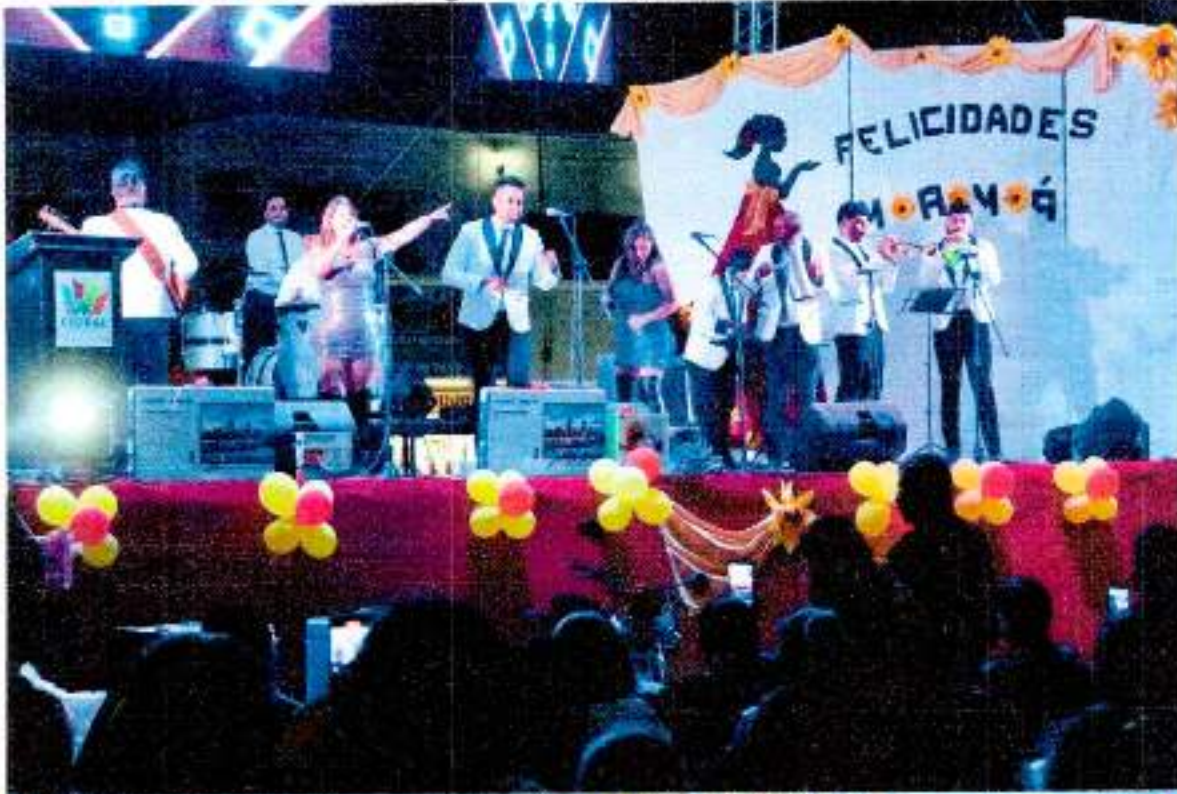
10 DE MAYO (DIA DE LA MAMÁ)