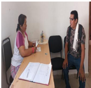
Tribunal Unitario Agrario Ciudad Valles, acompañamiento a ejidatarios y ejidatarias y fungiendo como traductora náhuatl en audiencia.