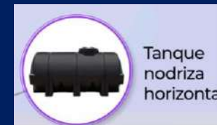
Tanque nodriza horizontal