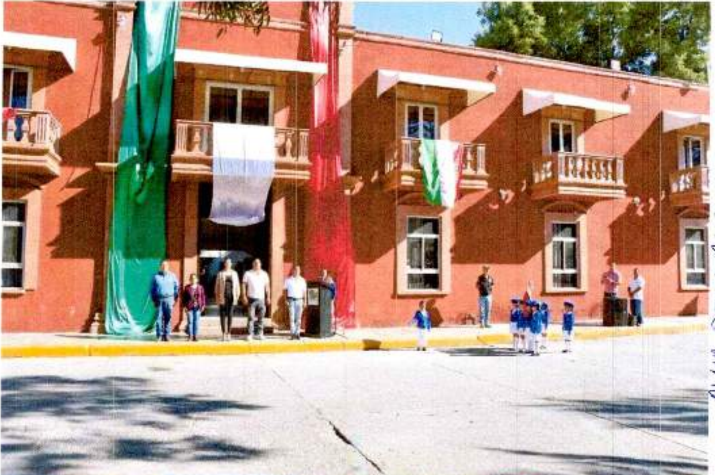
ALMA DELLA AGULLAR