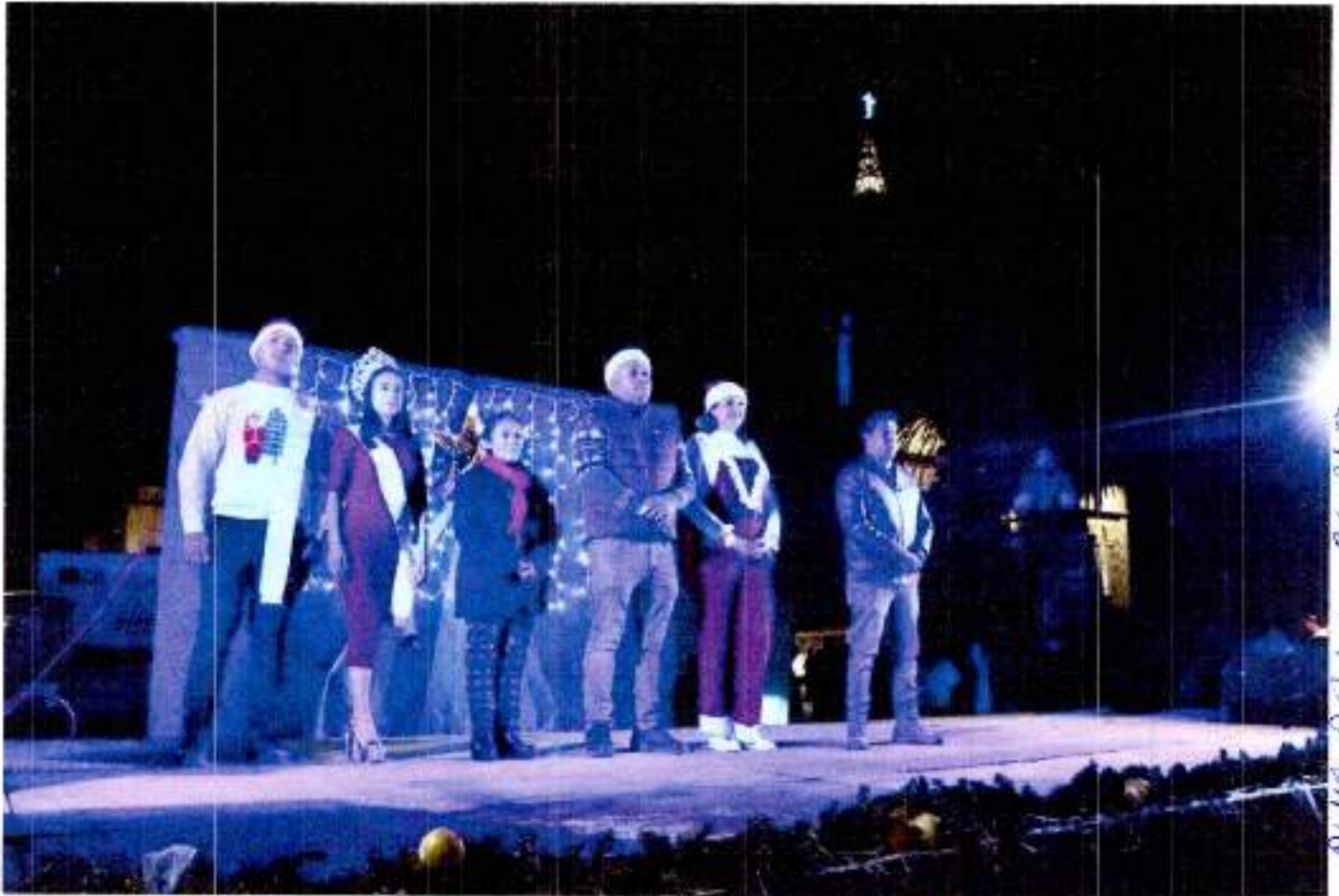
ALFA DELLA ACCIARA