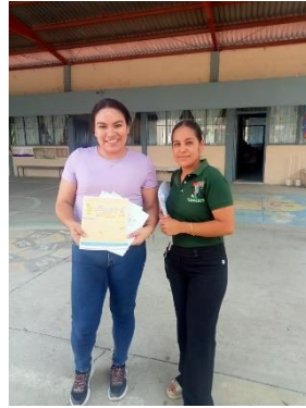
PRIMARIAS DE AGUA BUENA Y TAMASOPO CONCURSO DE DIBUJO 2024: