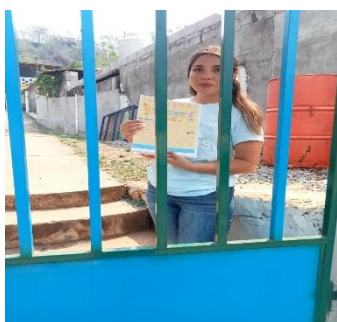
VISITA A LOS JARDINES DE NIÑOS TAMASOPO Y AGUA BUENA: