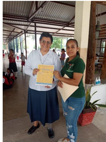
SECUNDARIAS Y TELESECUNDARIAS DEL MUNICIPIO CONCURSO DE DIBUJO 2024: