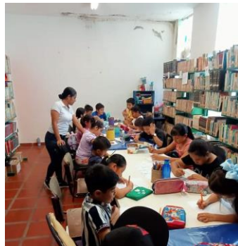
VISITA DE EL JARDIN DE NIÑOS: RAMON LOPEZ VELARDE DEL MUNICIPIO DE TAMASOPO.