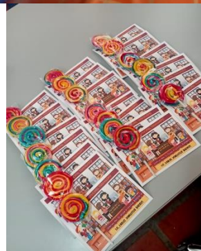
LLEVANDO A LAS ESCUELAS LA CONVOCATORIA DEL CONCURSO INFANTIL 2024.