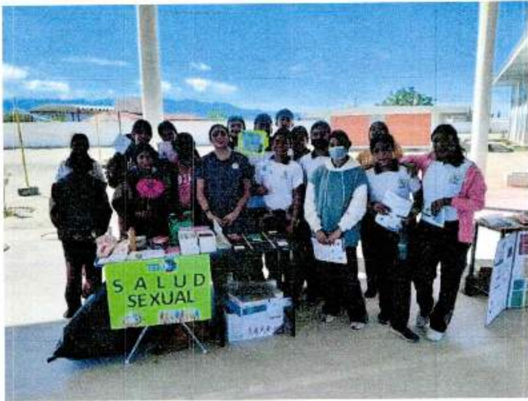
ALFA DELTA AGUINALA