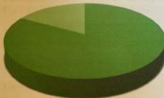
Recursos de Revisión

■ Solicitudes de Acceso a la Información ■ Recursos de revisión