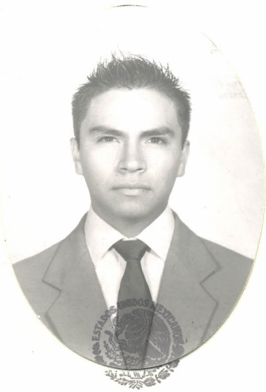
SISTEMA EDUCATIVO NACIONAL TAMAULIPAS

con el plan y programas de estudio autorizados por la Secretaría de Educación Pública y aprobó el examen profesional reglamentario.