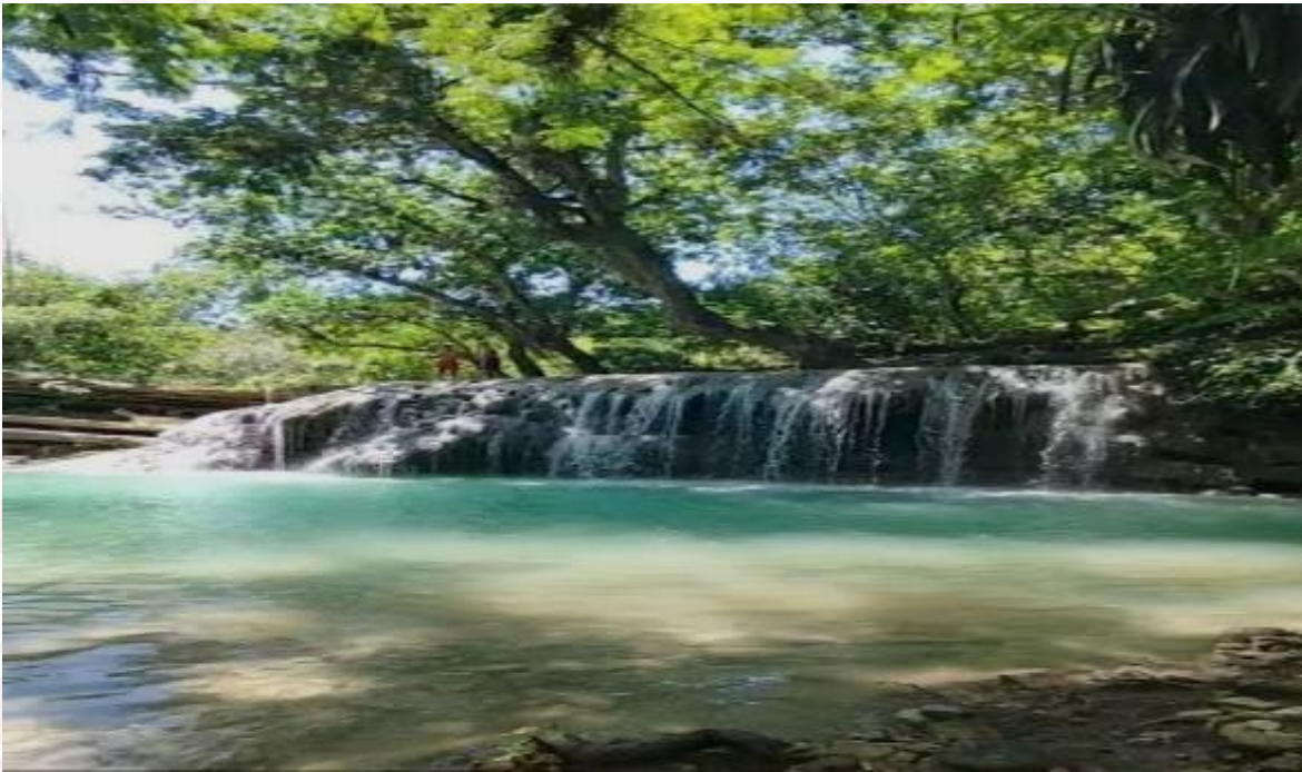
Imagen 9. Poza del mono Tanzumatz

Se aplica algo de senderismo, se logra apreciar la naturaleza y les relaja el sonido del agua entre las rocas, es una experiencia única (solo en temporada de lluvias) entrada gratis.