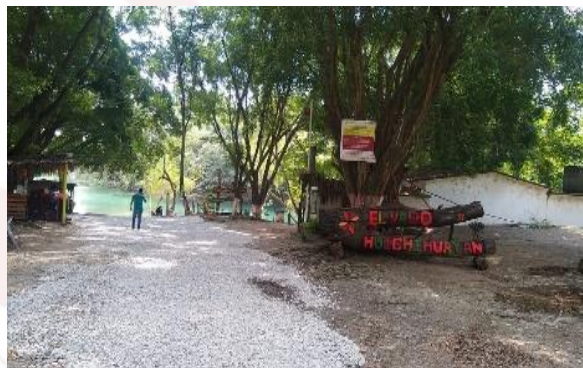
Imagen 5. Entrada al rio ecoturístico el vado