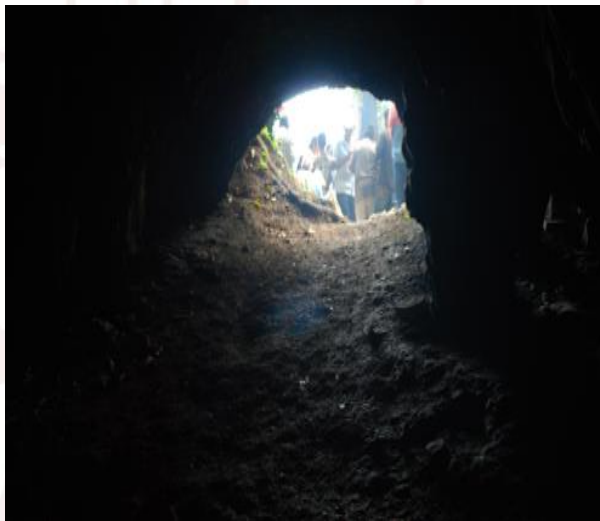
Imagen 7. Entrada a la cueva sagrada

Entre la fauna de la zona se encuentran aves como el periquillo quila, el hocofaisán y el tucancillo verde. También se pueden encontrar mamíferos como la onza o leoncillo, el venado temazate y el tigrillo, entrada gratis.