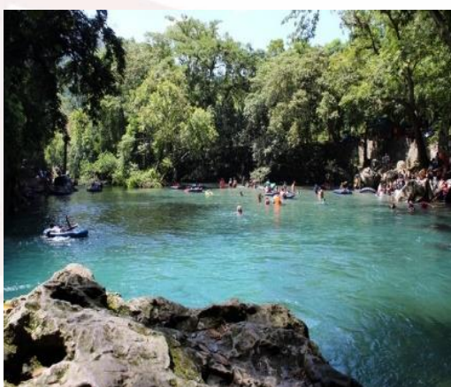
Imagen 1. Nacimiento de Huehuetlan

Ingresando desde la carretera nacional México-Laredo, ubicado exactamente a 3 km. de la comunidad de Huichihuayán, en la zona huasteca de San Luis potosí.