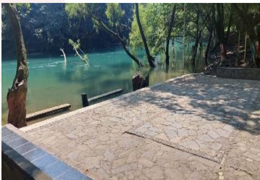
Imagen 4. Rio ecoturístico el vado

Ingresando desde la carretera nacional México- Laredo, a un costado de la Delegación de Huichihuayán a 200 metros hacia abajo se encuentra el rio Ecoturístico el Vado, puedes venir a disfrutar en familia, (entrada gratis).