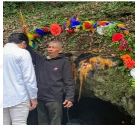
Imagen 8. Ritual en la entrada de la cueva