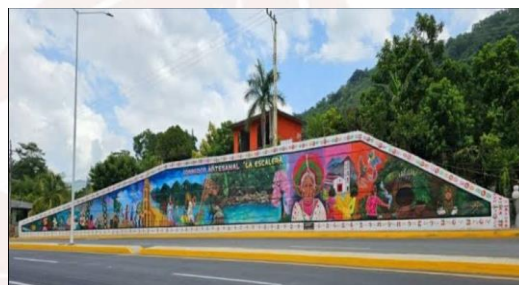
Imagen 3. Mural emblemático “La escalera”