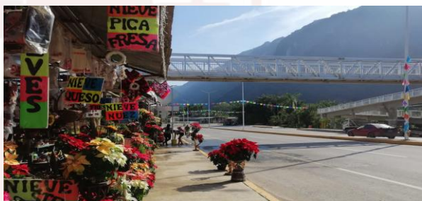
Imagen 2. Corredor turístico artesanal “La escalera”

Se trata de un espacio de exposición de artesanías ubicado en el km 55 en la carretera cd valles- Tamazunchale. Así mismo cuenta con un atractivo más como, un colorido mural que plasma los aspectos más emblemáticos de Huehuetlan, como la enigmática “cueva del viento y la fertilidad”, “el nacimiento de Huichihuayán” y la iglesia de “san diego de Alcalá”.