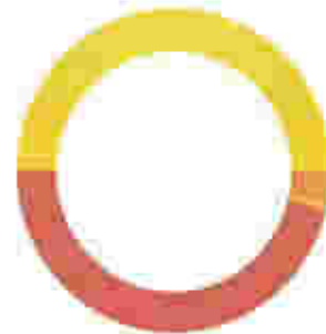
ENLACE GLOBAL PM S/INTERESES (Saldo inicial de $2,388.15)