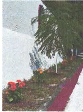
Ilustración 3.- Flores y ornamentas sembradas.

ACTIVIDAD: C1A4 Otorgamiento de permisos para cualquier trámite en materia de Ecología solicitado por la ciudadanía.