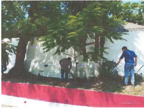
Ilustración 1.- Preparación de la jardinera en el Cementerio.

ACTIVIDAD: C1A2 Implementación de programa para reforestar diversas zonas del Municipio de Tancanhuitz.