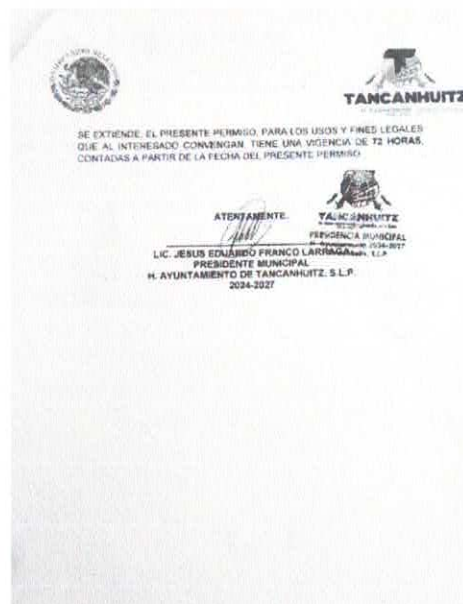
Ilustración 9.- Oficio 002. Permiso de traslado