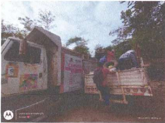
Ilustración 10.- Vaciado de residuos de la camioneta al camión.