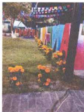
Ilustración 5.- Flores de Cempasúchil sembradas.