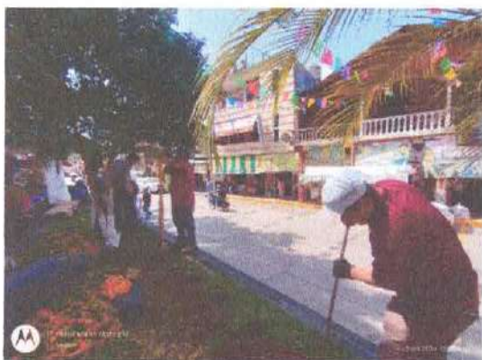
Ilustración 4.-Cabando hoyos para sembrar flores.