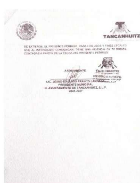
Ilustración 9.- Oficio 002. Permiso de traslado