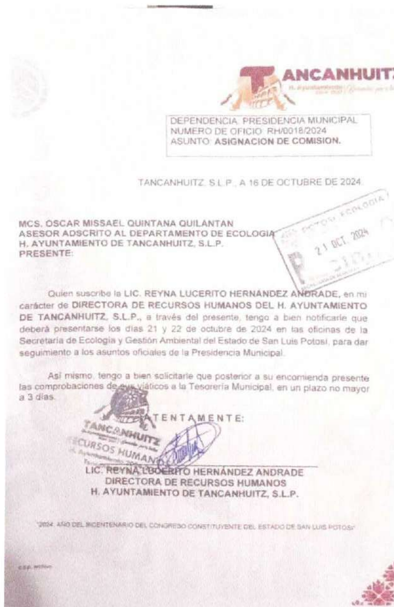
Ilustración 1.-Oficio de asignación de comisión.

ACTIVIDAD: C1A1 Capacitación en materia de ecología en instituciones educativas para generar conciencia.