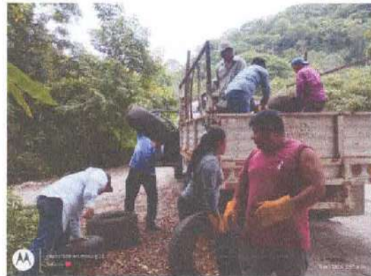
Ilustración 11.- Subiendo llantas a la camioneta