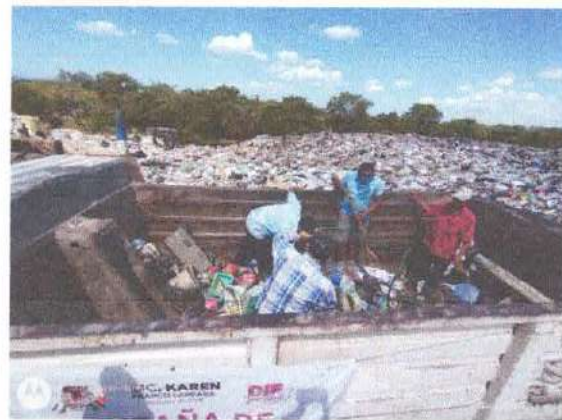
Ilustración 13.- Descarga de RSU en el relleno sanitario.