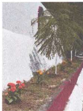
Ilustración 3.- Flores y ornamentas sembradas.