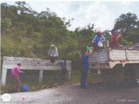
Ilustración 12.- Recolectando residuos en los puntos de acopio.