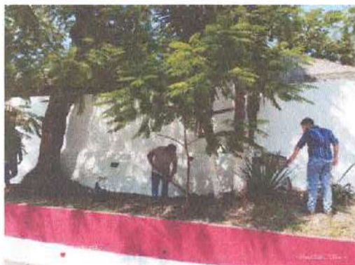
Ilustración 2.- Preparación de la jardinera en el Cementerio.