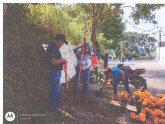
Ilustración 6.- Alistando jardinera en la entrada del municipio.