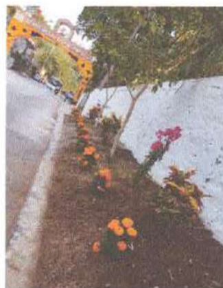
Ilustración 7.- Jardinera lista.