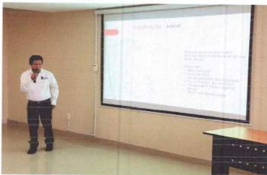
Figura: Participación de primera acreditación de Lengua Materna de Instituto Tecnológico de Cd. Valles