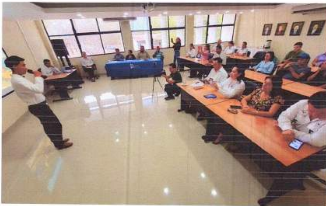
Figura: Participación de segunda acreditación de Lengua Materna de Instituto Tecnológico de Cd. Valles