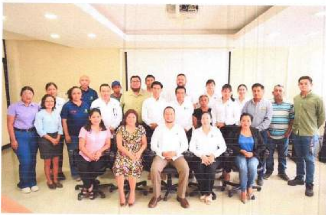
Figura: Asistentes a protocolo de acreditación de Lenguas Maternas de Instituto Tecnológico de Cd. Valles