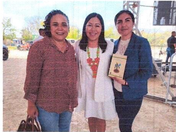
Figura: Vínculo con la Diputada Bernarda Reyes Santiago