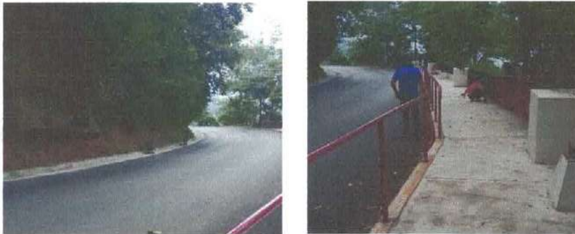
(Ilustración.- limpieza de carretera y caminos para el peatón)