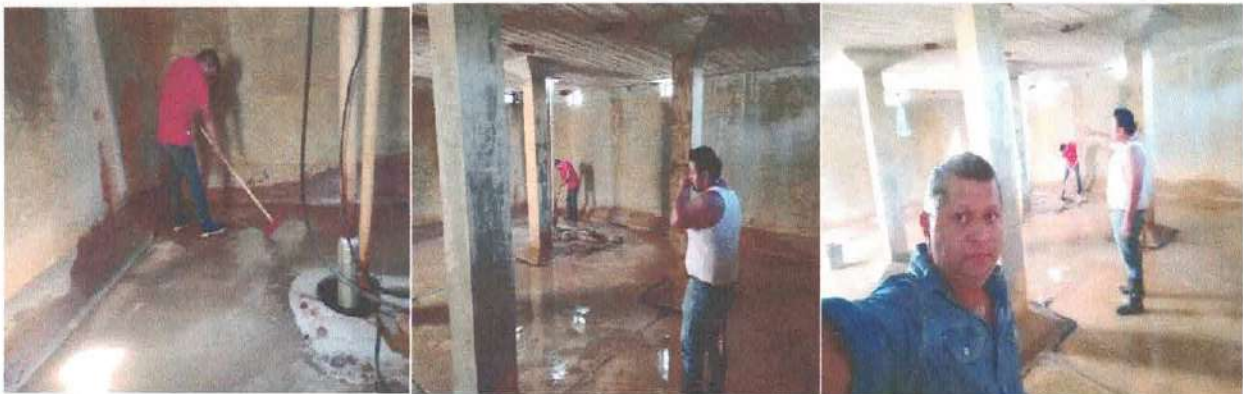
(Limpieza y mantenimiento de los tinacos de almacenamiento de agua potable)