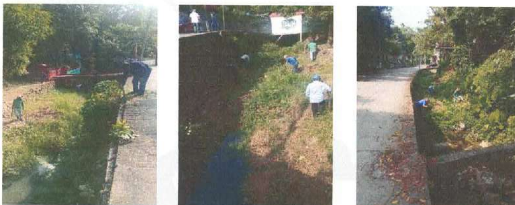
(Ilustración.- limpia con chapoleo y recolección de basura para evitar la propagación del mosquito)