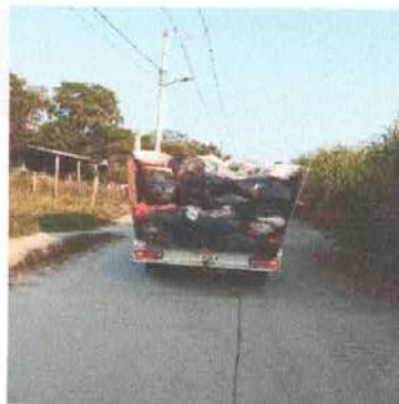
(Ilustraciones.- Recolección de basura en los municipios de Tancanhuitz)