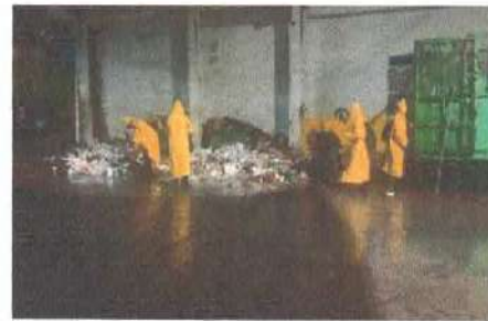
(Ilustraciones.- Recolección de basura en el municipio para mantener limpio y tener salubridad)