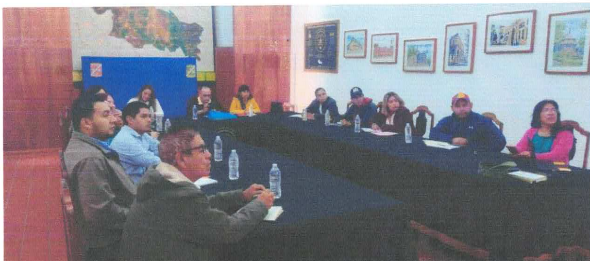
CAPACITACIÓN EN LA 12ª ZONA MILITAR.