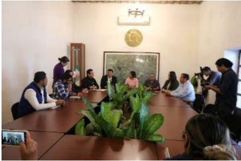
Villa de Pozos.

Para promover la Campaña de Certificación y concretar la meta de más de 1,500 Funcionarios Certificados, se llevó a cabo una Gira Estatal de Difusión del Programa de Certificación, con la organización de 4 Ruedas de Prensa en los Municipios de: Villa de Pozos, Matlapa, Ciudad Valles y Rioverde.