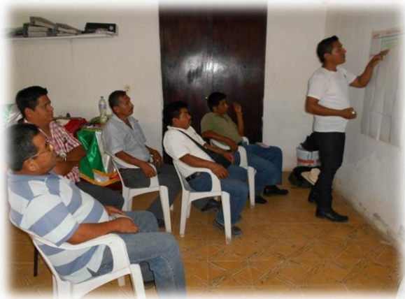
Ilustración 03. Grupo de trabajo con los hombres donde expusieron sus necesidades y problemáticas.