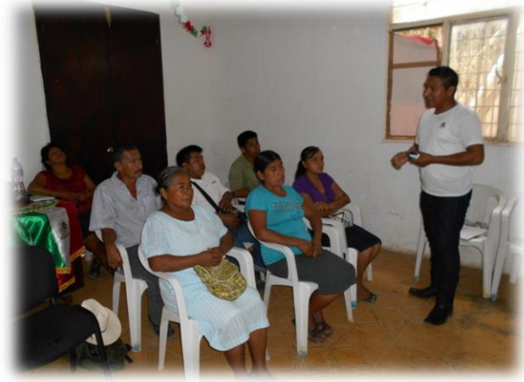
Ilustración 02. Explicación de las actividades para realizar la evaluación de necesidades y temas de interés.