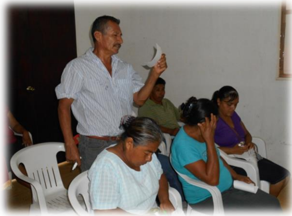
Ilustración 01. Participación de los asistentes en el encuadre del taller de evaluación diagnóstica.