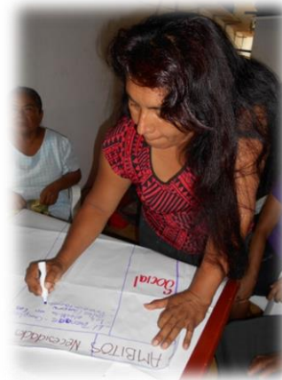
Ilustración 04. Grupo de trabajo con las mujeres donde identificaron sus necesidades y problemáticas.